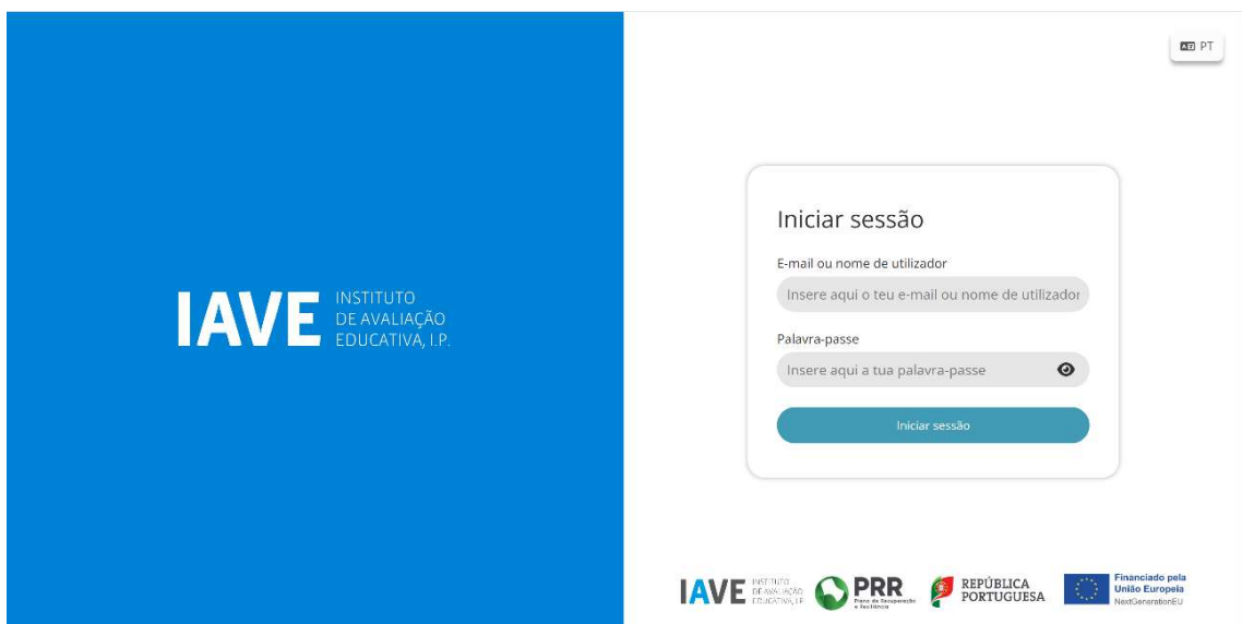
Figura 1 – Acesso à Plataforma de Realização de Provas do IAVE

b) Apenas para o online , selecionar o endereço eletrónico https://provas.iave.pt .