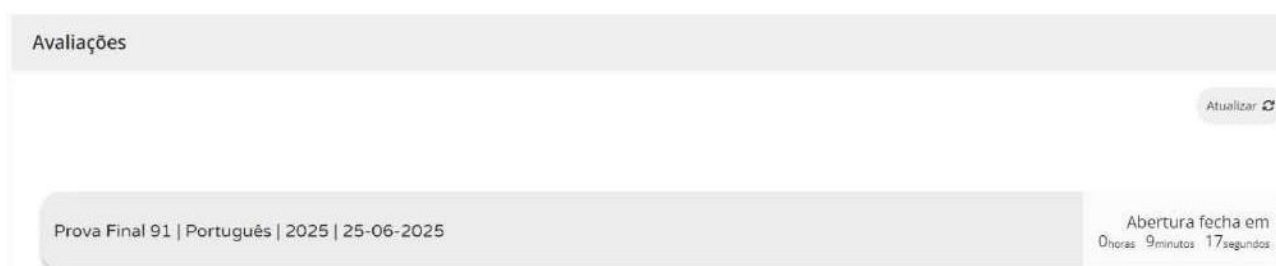
Figura 2 – Acesso à prova a realizar

11.11. Nas provas, ao clicar em “Iniciar sessão”, por exemplo, para um aluno que realiza a prova final de Português (91), aparece o seguinte ecrã: